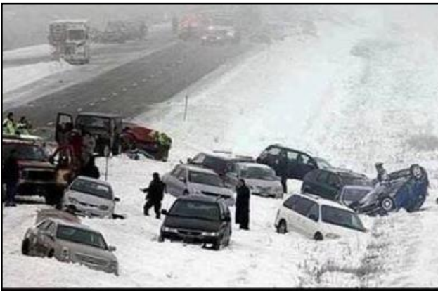
Zimní sraz milovníků letních gum

„Lékař mi tvrdil, že mám ideální předpoklady k lyžování.“ „Jak to poznal?“ „Říkal, že mi dobře srůstají kosti.“